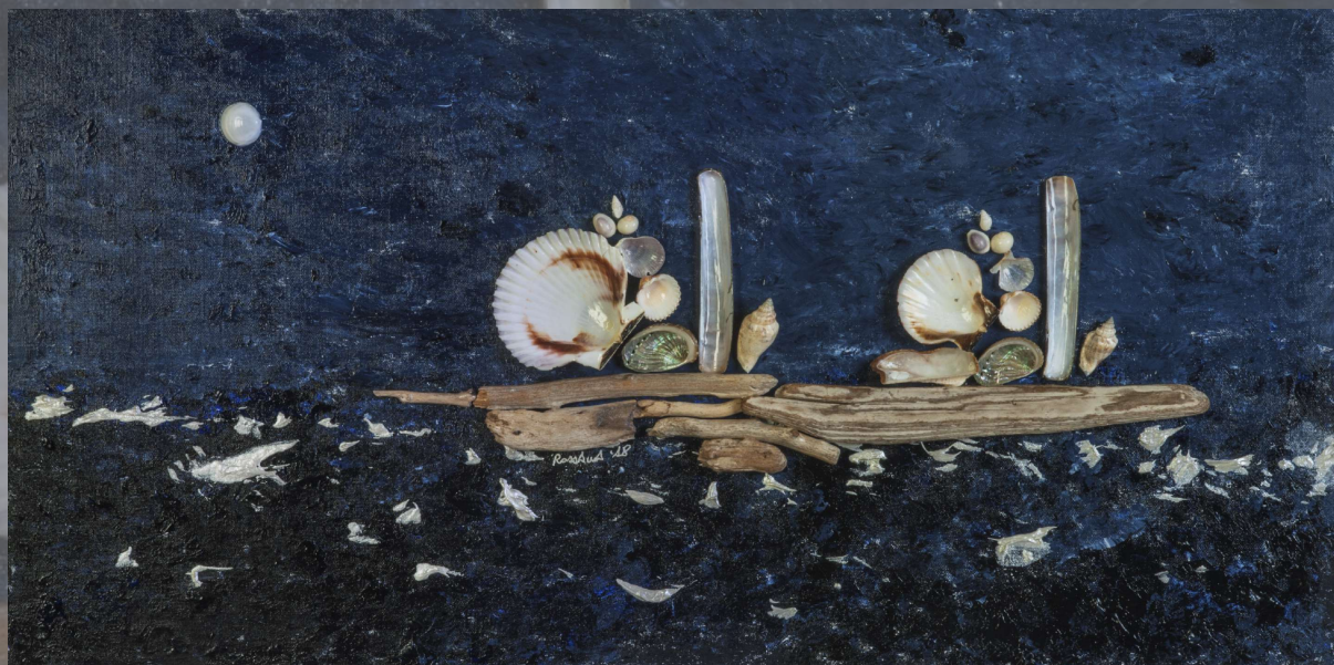
IL VELIERO E LA LUNA